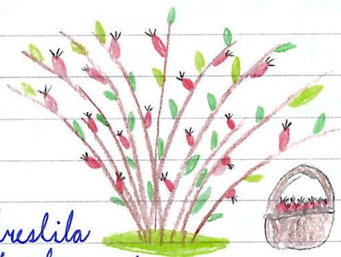
Nakreslila Eli Hanakvasová Třída 4.